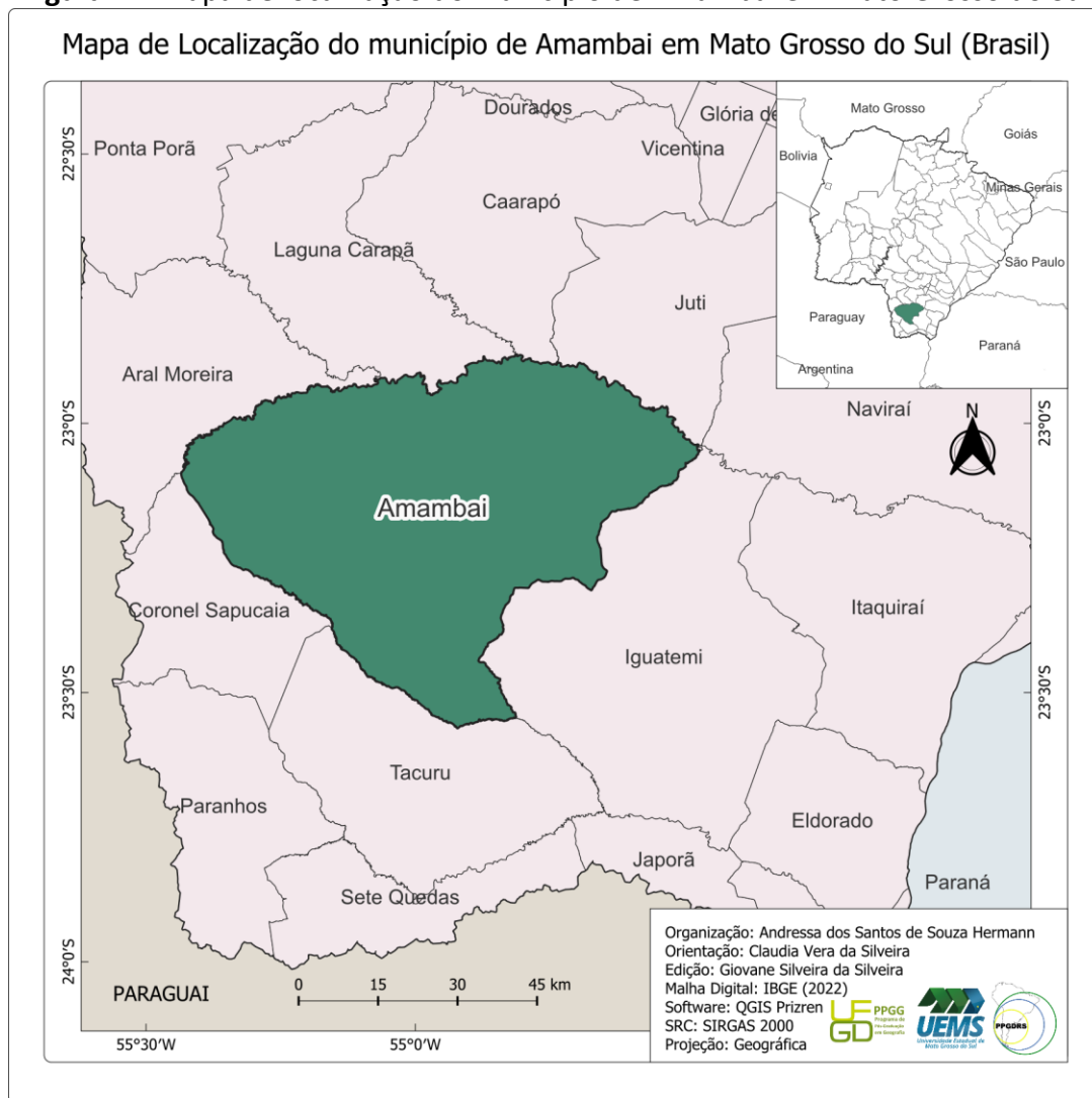
Figura 1 – Mapa de localização do município de Amambai em Mato Grosso do Sul

Destas têm-se que duas, Aldeia Limão Verde e Aldeia Amambai, estão localizadas próximas a área urbana do município, e na qual a população têm completo acesso a serviços, comércio e toda uma gama de equipamentos urbanos coletivos. Já a aldeia Jaguari, fica distante em aproximadamente 40 km da área urbana. O acesso dos residentes na aldeia Jaguari à área urbana se dá via estrada de chão, fator esse que impacta com aspectos positivos e negativos a esta população, entre tais a manutenção de características da cultura guarani kaiowá, no contraponto, o acesso insuficiente e quase nulo de serviços públicos essenciais.